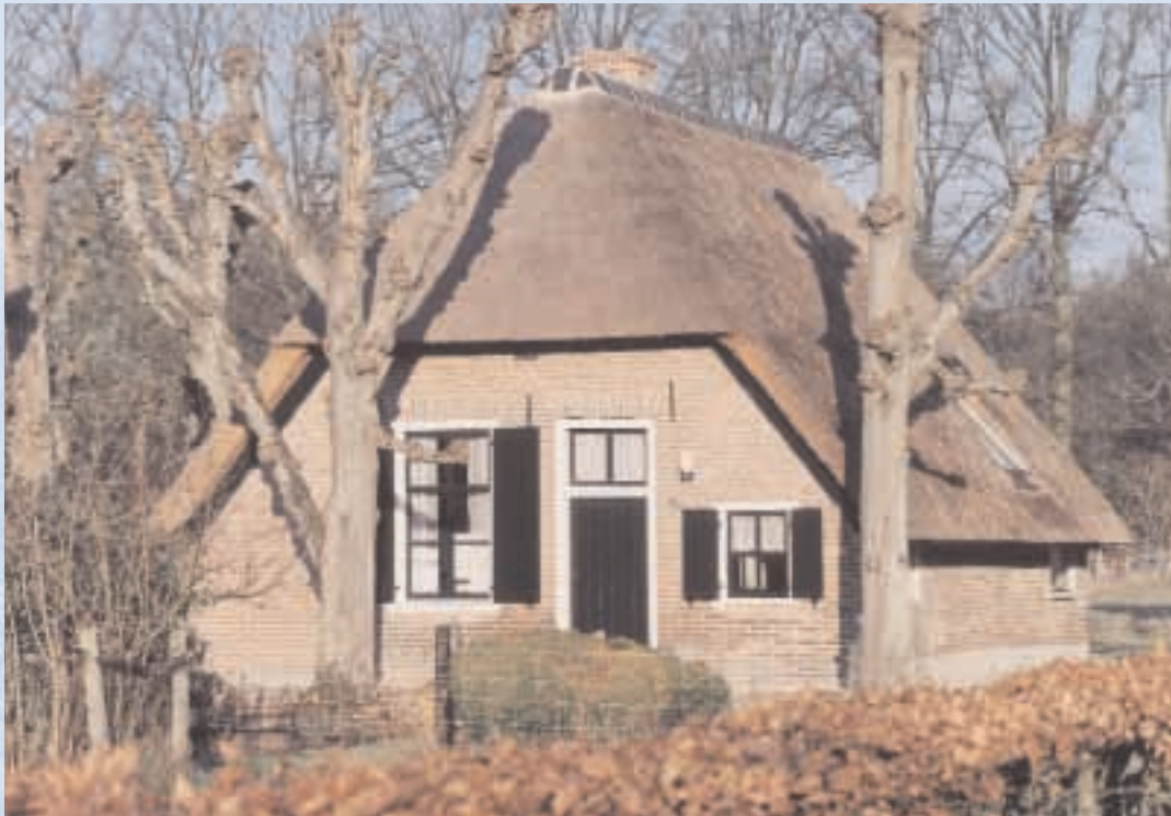
Een van de vele monumenten die Apeldoorn kent

waardevolle stads- en dorpsgezichten. Dit gebeurt gezamenlijk met de eigenaren van monumenten en beeldbepalende panden. Daarom verstrekt de gemeente technische informatie en zijn er provinciale en gemeentelijke subsidiemogelijkheden bij restauratie of onderhoud.