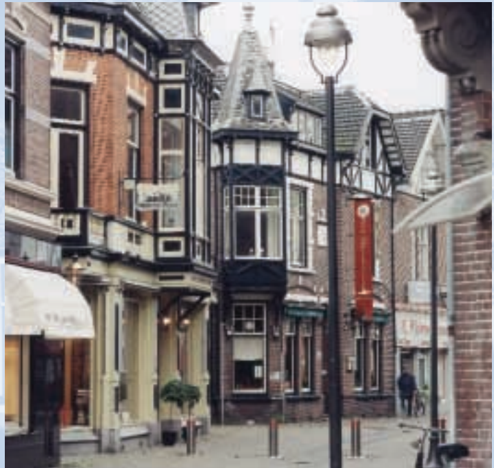
Een monumentale straat in de binnenstad

In een gemeentelijk beschermd stads- of dorpsgezicht bestaat soms de mogelijkheid bouwvergunningvrij te bouwen. Dit is geregeld in de Woningwet. Een monumentenvergunning is altijd nodig bij het geheel of gedeeltelijk afbreken van een bouwwerk in een beschermd stads- en dorpsgezicht.